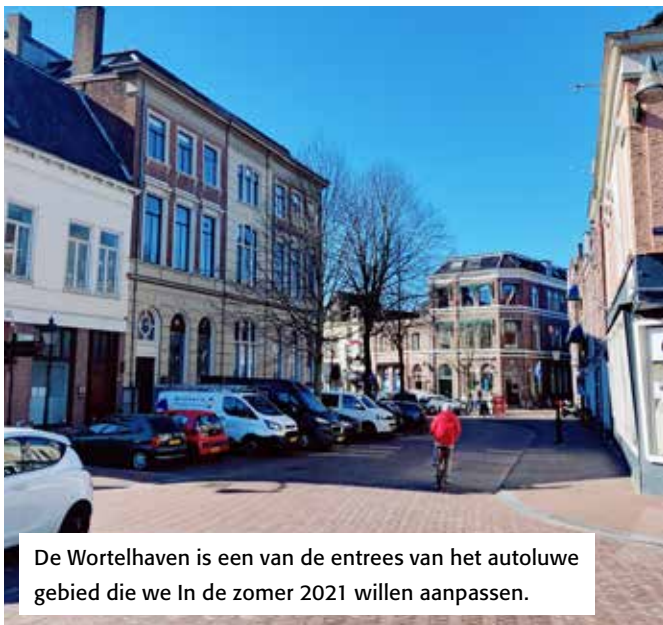
De Wortelhaven is een van de entrees van het autoluwe gebied die we in de zomer 2021 willen aanpassen.

In de zomer van 2021 voeren we de eerste maatregelen door. Dat zijn het invoeren van het toegangsbeleid en de inrichting van de